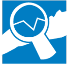
Gràfic 1 Població estacional ETCA %. Municipis del Maresme. 2023p