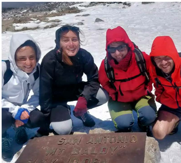
Cim del Mount Baldy, a prop de Los Angeles.

Finalment, com a punt positiu, dir que hem vingut a parar en un lloc amb paisatges increïbles! Califòrnia té molta varietat, des de muntanyes de 3000 metres a platges precioses on fer surf o un desert a poques hores en cotxe. Val molt la pena fer excursions i gaudir de la natura en general, no et deixa indiferent!