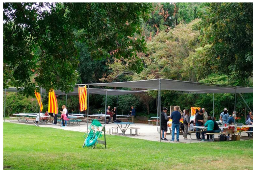
Aplec català per Sant Jordi.

Malgrat aquestes petites coses, que hem anat aprenent i resolent amb el temps, hem de dir que està sent una experiència molt bona! Hem fet molts bons amics i amigues i tothom que viu aquí t'ajuda molt, explicant-te coses, resolent-te dubtes... tothom sap que als inicis et sents molt perduda. Fins i tot hi ha un casal de Catalans a Los Angeles que organitza activitats, vam fer un aplec de primavera per Sant Jordi, gairebé com ser a casa!