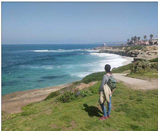
Platja de La Jolla, San Diego.

Permís de feina: només es pot demanar una vegada al país si no t'han contractat abans. Cal omplir uns formularis online que es troben a la web de l'USCIS, imprimir-los i enviar-los per correu ordinari amb fotocòpies de tota la documentació que es requereix i un xec amb l'import requerit.