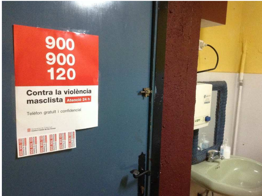
(lavavos de cafeteries)

Material de la Generalitat contra la violència masclista, distribuïda per comerços, mobiliari urbà, etc.