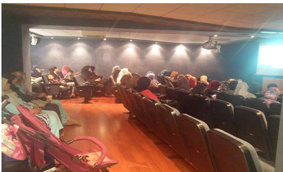
Una de les activitats de l'associació Hidayat de Mataró

La percepció que es té dels col·lectius de dones immigrades per part de les dirigents de les associacions de dones és que participen molt poc en la vida sociocultural del municipi. Una percepció que es basa en la realitat visible però obvia la realitat de fons que fa que aquestes dones no participin tant: el desconeixement de l'idioma i de l'entorn, el baix nivell d'estudis, la manca d'interès en activitats en les que no s'identifiquen, etc. Si es fes un treball d'aproximació basat en l'intent d'entendre aquesta realitat, trobar espais en comú on poden compartir sabers fer, de ben segur que poc a poc i pal·liant les dificultats abans esmentades, es pot arribar a aconseguir la participació d'una part d'aquestes dones; totes no perquè les dones autòctones tampoc participen totes.