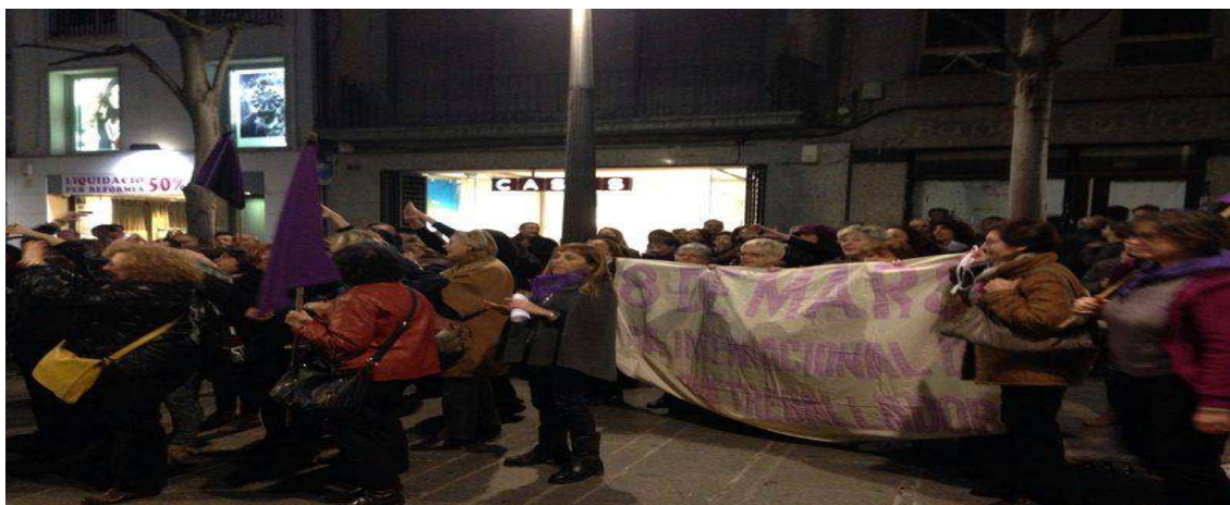
Una de les concentracions mensuals contra la violència masclista, organitzada per la plataforma Teixit de Dones de Mataró

Però si fem una visió ràpida a totes aquestes entitats ens adonem que la darrera línia de treball no és una prioritat.