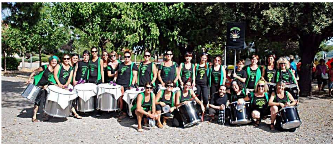
Atabalades, grup de batucada de dones de Premià de Mar

La diferenciació en l'ús de les TIC entre la gent jove i la gent que no ho és tant pot ser un altre factor que fa difícil el relleu generacional en el sí de les entitats. Les primeres entitats de dones, tot i comunicar-se cada cop més via internet, no hi tenen el mateix accés que la gent jove. La gent jove és molt més activa en les xarxes socials, les convocatòries i decisions a vegades es prenen per via virtual per estalviar temps que d'una altra manera dedicuena les reunions.