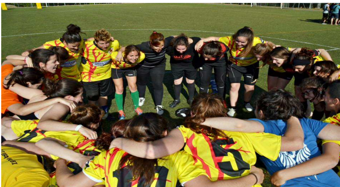
Components de la secció femenina de l'entitat Rugbi la Tordera

L'associació de Rugbi de Tordera és una associació creada l'any 2013 i té dues seccions, una masculina i l'altra femenina. La secció femenina pretén empoderar les dones físicament i preparar-les per ser capaces de defensar-se contra qualsevol agressió que puguin rebre.