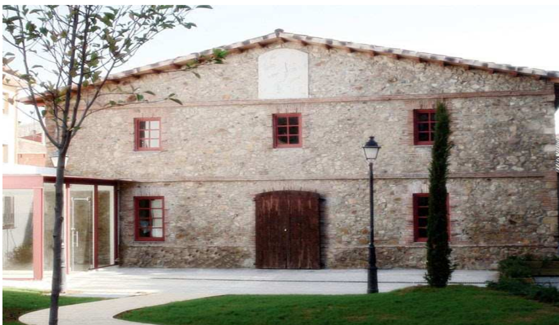
Can Florenci, seu del Casal de Dones de Palafolls.

Les entitats que disposen de locals troben més facilitat i més llibertat per organitzar activitats segons necessitats i interès, tot i que també els han de mantenir elles mateixes pel que fa a la seva neteja.