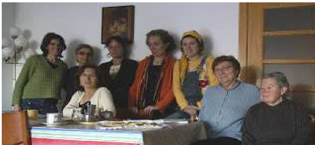
Grup de Suport a les Dones de Matagalpa amb algunes membres de la Vocalia de Dones de Rocafonda (Mataró)

A continuació recollim aquests grups amb l'especialitat de cadascun d'ells: