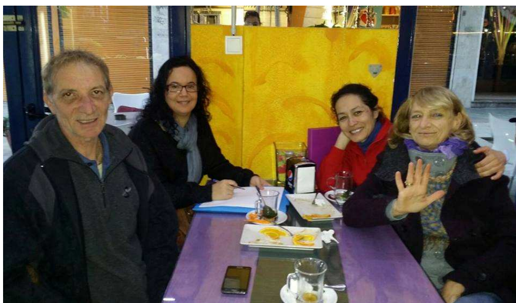
Amb les persones entrevistades de l'associació Arenys Viu i Conviu