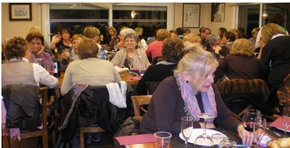
Foto d'un dels sopars de l'associació Dona per la Dona de Llavaneres

De la mateixa manera que Mataró és capdavanter en la creació de vocalies de dones, altres municipis del Maresme són capdavanters en la creació d'associacions de dones pròpiament dites. Hi ha entitats la creació de les quals remunta als anys noranta com l'associació Dona per la Dona de Sant Andreu de Llavaneres (1994), El Casal de Dones de Palafolls (1995) i l'associació Montserrat Roig d'Alella (també en 1995).