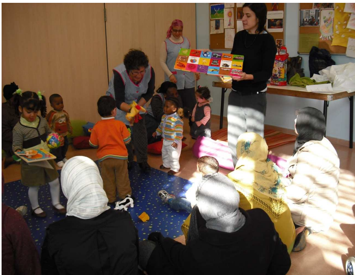
Activitats amb dones i nes/es a l'espai maternoinfantil del projecte Totes Plegades.

Tot i així, hi ha algunes entitats que ofereixen activitats de foment de l'autonomia de la dona d'origen estranger com l'aprenentatge de la llengua, el coneixement de l'entorn, activitats formatives, etc., entitats que ja hem citat anteriorment.