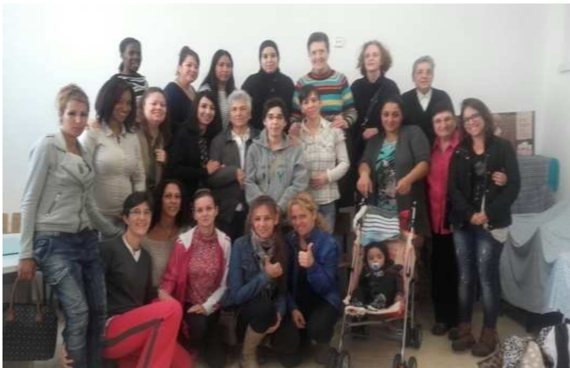
Un dels capítols del programa setmanal de ràdio de l'associació DonaViva d'Arenys de Munt