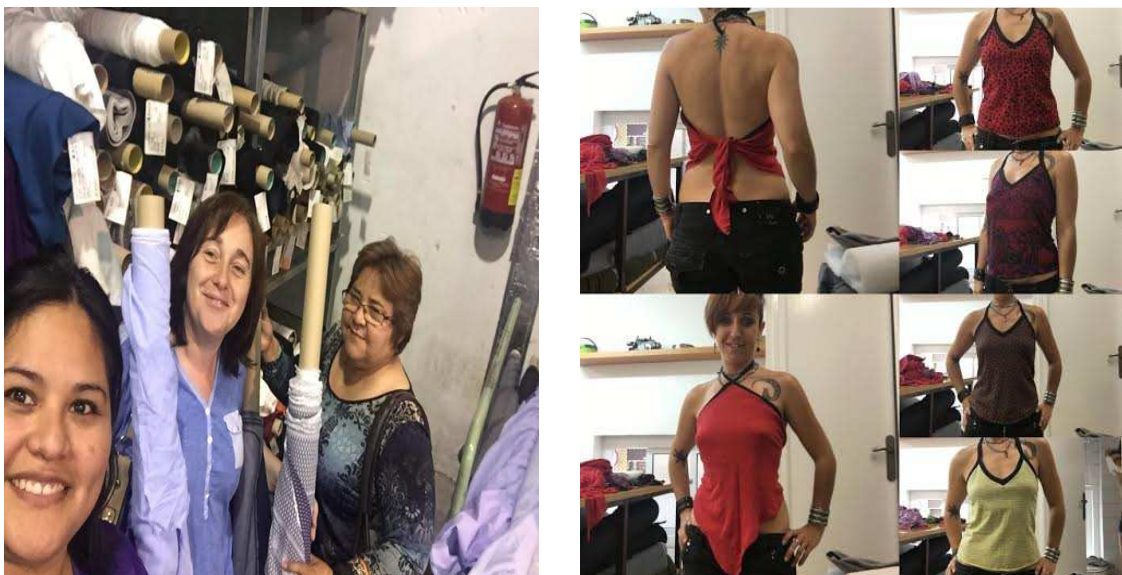
Taller de costura de l'associació Maresme Dona Activa't.

A nivell més formatiu, l'associació Dona Activa't realitza un taller de costura amb un preu molt assequible amb l'objectiu de treballar posteriorment per la inserció laboral d'aquestes dones.