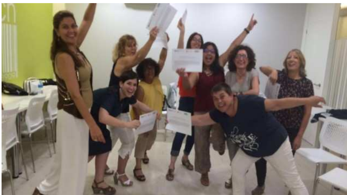
Una de les activitats de l'entitat Dóna't un impuls

L'Associació Dóna't un impuls, creada l'any 2014 es dedica a fomentar l'emprenedoria femenina. Des de la seva creació fins ara, ha realitzat un gran nombre d'accions enfocades a fomentar l'accés de les dones a l'auto ocupació mitjançant la creació d'empreses. La seva acció consisteix en l'apoderament de la dona mitjançant la formació, el coaching, les mentories, etc. Van organitzar tallers, sopars, viatges i moltes altres activitats.