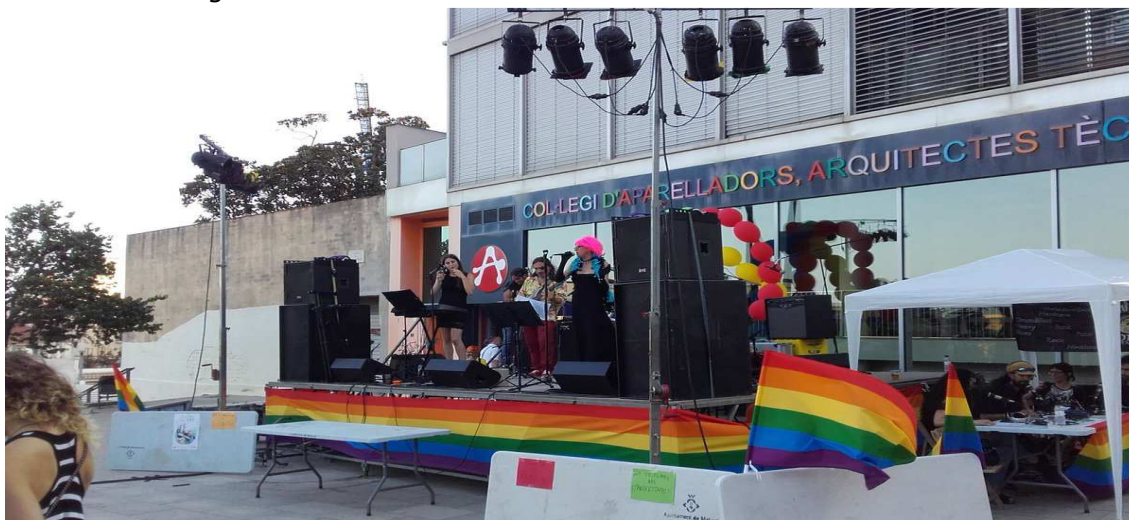
Primera celebració a Mataró del Dia de l'Orgull LGTBI el passat 01 de juliol 2016.

Al Maresme es van fer accions amb motiu del Dia de l'orgull LGTBI a Mataró, Malgrat de Mar i Montgat, però les entitats del Maresme que no es dediquen al tema no han organitzat res.