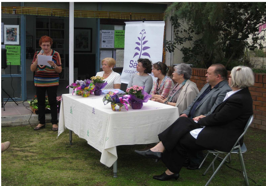
Festival Som Àfrica de l'associació Mares Malabristes de Canet de Mar