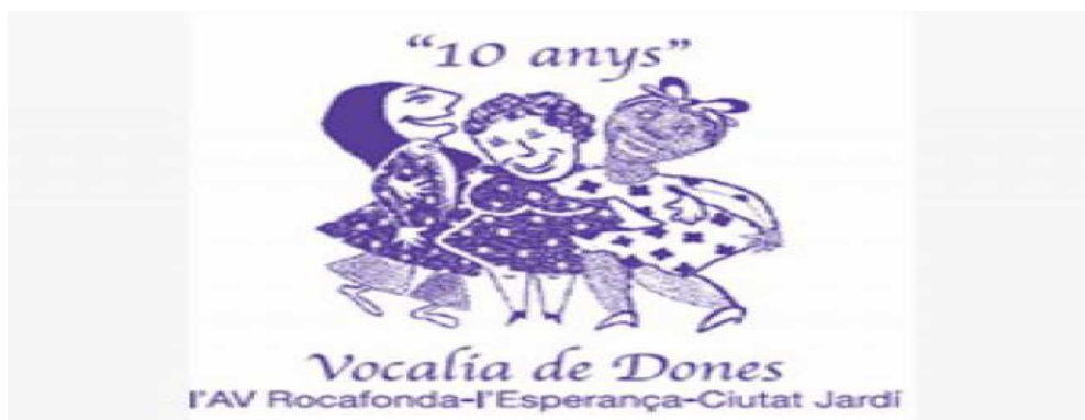
Logo de la Vocalia de Dones de l'Associació de Veïns de Rocafonda-l'Esperança i Ciutat Jardí

En altres municipis de la comarca també ens trobem amb aquest format d'entitat però ni amb la mateixa quantitat ni és tan antic, més aviat es tracta d'una realitat nova. Bàsicament, estem parlant de tres municipis en els que hi ha grups de dones dins d'entitats que no són de dones: Premià de Dalt, Premià de Mar i Tordera. Val a dir que la Vocalia de Dones Santa Anna-Tió de Premià de Dalt i Premià de Mar ve d'una associació de veïns tradicionalment dirigida per dones, però que no feia res específic per dones fins que es va crear la vocalia.