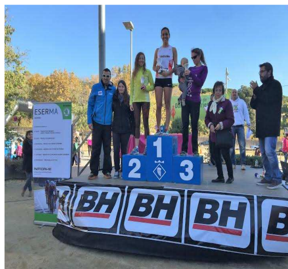
La cursa contra la violència masclista de l'ass. Dones Solidàries d'Alella en la que participen homes i dones