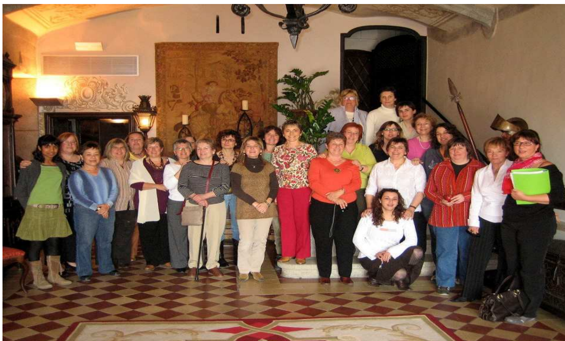
Una de les trobades de la Federació d'Associacions i grups de Dones del Maresme. Aquesta va ser a Arenys de Munt.

Arribats a aquest punt, es planteja la necessitat de dotar les entitats d'aquesta estructura important sense que els suposi cap desgast. Aquest és un dels punts a debatre en la jornada programada en el marc d'aquest projecte.