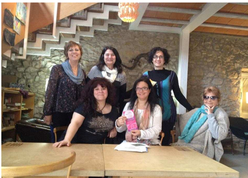
Amb les dones del Casal de Dones de Palafolls, després de l'entrevista.

- Organització de la jornada: juny del 2016.